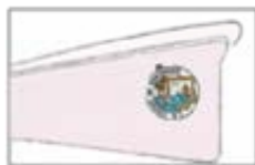
CIUDAD DE SANTANDER